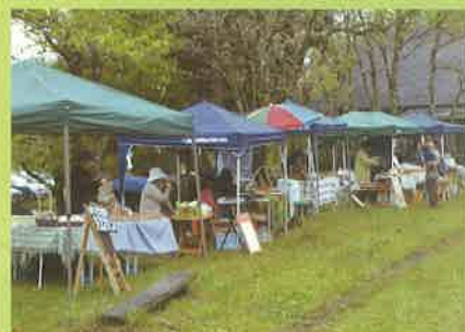
★飯田高原アースマーケット