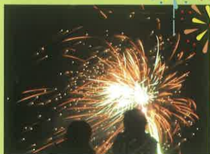
★筋湯温泉花火大会