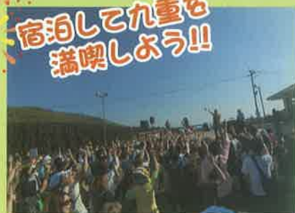
★俺たちのふるさと祭り